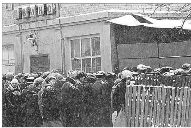
Блокадный Ленинград? Нет, Калуга 20 лет назад.

«Смотрю вокруг и удивляюсь: все жалуется на жизнь. И то не так, и это не эдак. Дескать, стабильности нет!»